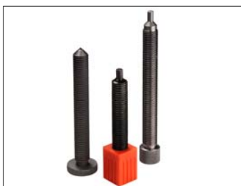
Diamanter för formning av slipskivan.