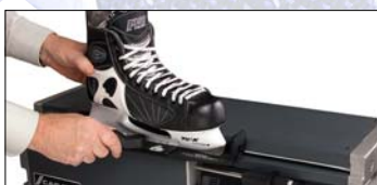
1 Spänn fast

I den mest avancerade modellen kan varje åkare få sin specialslipning lagrad i ett dataminne och därmed kunna vara säker på att varje gång få den exakta slipning som önskas. Upp till 99 individuella slipprogram kan lagras per minneskassett. Utvecklingen av CAG ONE har pågått sedan starten 1986 och idag finns ca 3500 exemplar över hela världen.