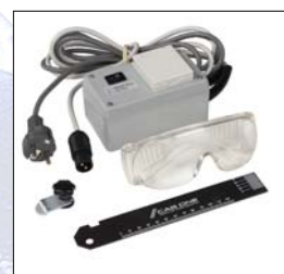
Styrenhet för dammsugare, spetssskydd, skyddsglasögon och transportlinjal,

SPEED ONE och LONG ONE slipar befintlig profil snabbt, 15-20 skridskopar per timme.