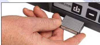
2 Ställ in slipdata

Maskinen är mycket enkel att sköta. Vem som helst kan använda den. Skridskorna får en utomordentlig finish som ger en låg friktion mot isen.