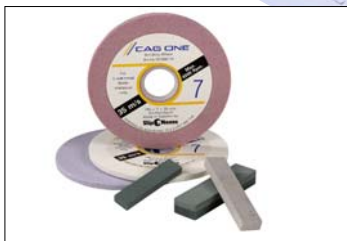
Slipskivor och brynor med olika egenskaper